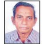
हीरालालजी मंदिर समिति